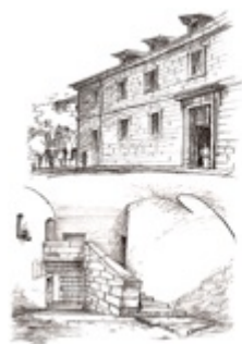
Cuartel de Inválidos y Voluntarios a Caballo San Lorenzo de El Escorial, 1776

A continuación Carlos expuso las razones que han llevado a Alternativa Municipal Española a presentar la citada moción, entre las cuales destacan las siguientes: